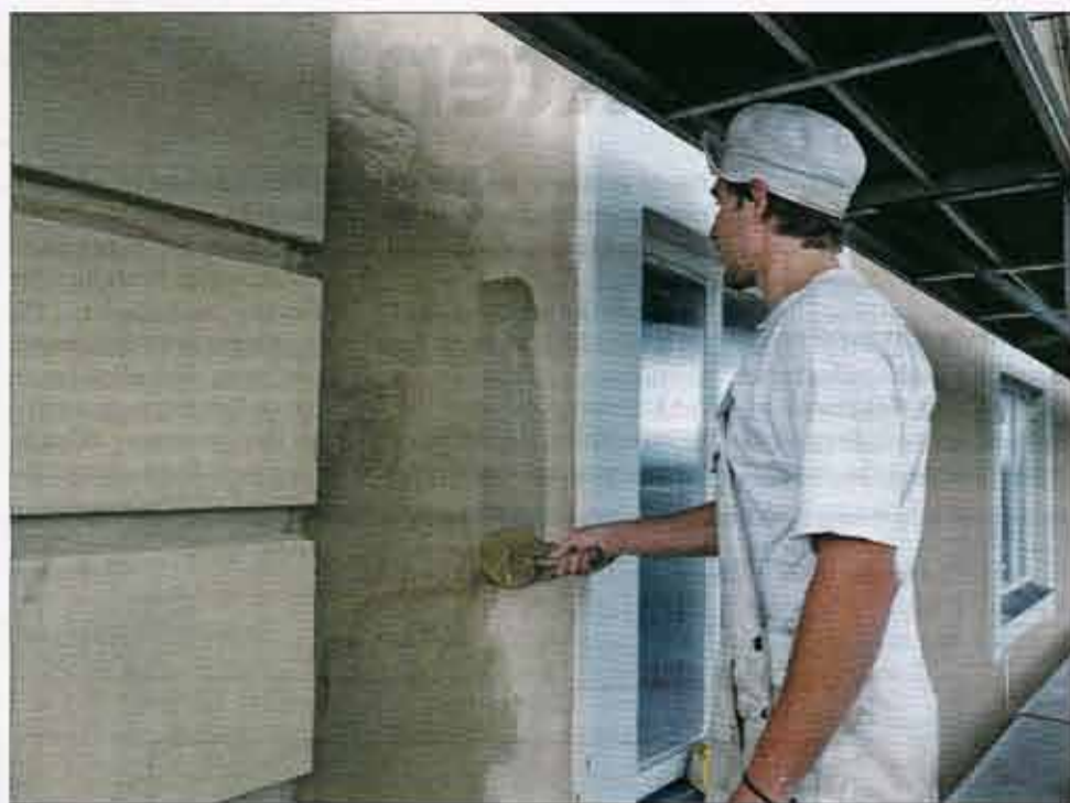
St. Astier kalkmaling er indfarvet med naturlige franske oxider og er nem at påføre.

naturlige hydrauliske kalkmaterialer faktisk nemme at arbejde med.