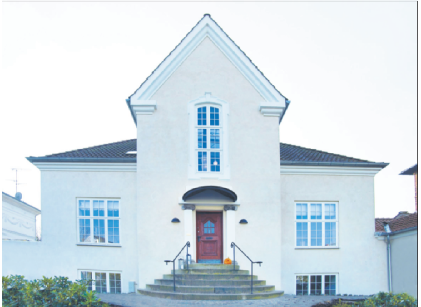
Huset er udvendigt isoleret med Isopore isoleringssystem. En unik diffusionsåbenhed eliminerer problemer med ophobet fugt mellem isolering og mur.

Isopore bruges både til indvendig isolering og ud-