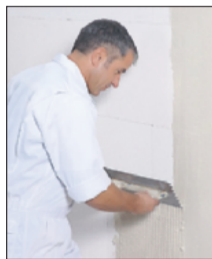
Enkel og hurtig montering reducerer arbejdstiden med op til 50 pct.

Multipor isoleringspladen monteres nemt med Isochaux isoleringsmørtlen, der også bruges til den efterfølgende pudning. Isochaux er en færdigblandet mørtel, specielt udviklet til Multipor isoleringsplader. Den er kalkbaseret, har stor vedhæftning, intet svind, meget høj elasticitet er meget diffusionsåben.